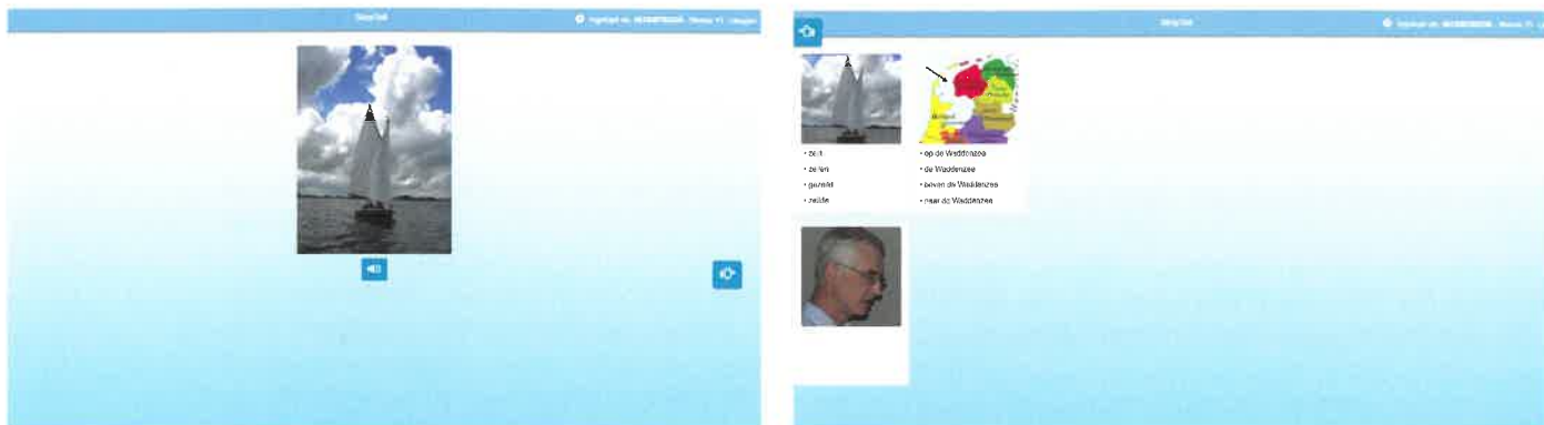
Figuur 1. Links: Het startscherm van een oefening. De gebruiker hoort de inrotextst: 'Jos heeft een goed weekend achter de rug. Hij heeft op de Waddenzee gezeild. Wie heeft dit weekend wat gedaan?'. Rechts: Nadat de afbeeldingen van de telegramstijluiting (boven in het scherm) in willekeurige volgorde zijn aangeboden, kunnen ze een-voor-een aangeklikt worden om ze (onder in het scherm) te ordenen tot een grammaticaal correcte telegramstijluiting.

Gebruikers leren hun boodschap eerst in gedachten (conceptueel) te plannen. Hierbij gebruiken ze nog geen taal. Zij ordenen hun boodschap aan de hand van afbeeldingen in de juiste telegramstijlvolgorde. De woordvormen worden ter ondersteuning van het taalbegrip gegeven, maar kunnen nog niet gekozen worden (zie figuur 1). Pas als de afbeeldingen in een